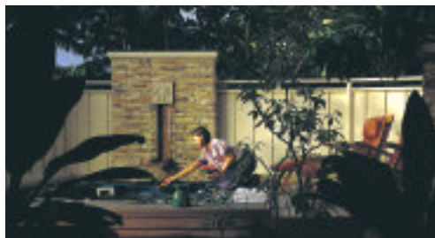
Villa Deluxe Jacuzzi Oceanview