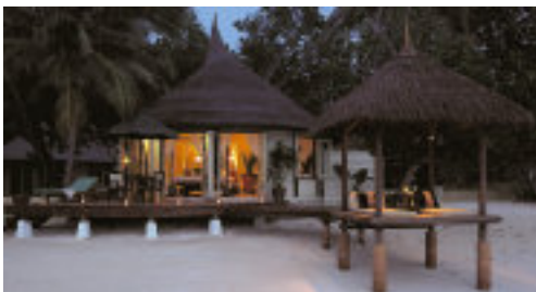
Villa Deluxe Beachfront

Avec participation : plongée sous-marine, ski nautique, pêche au gros sur demande.